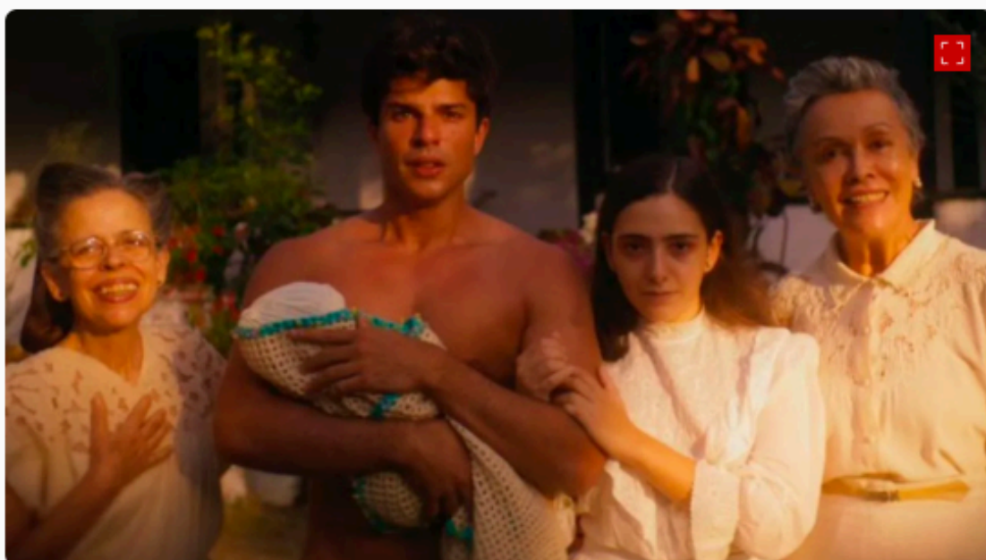
Cena de “A Herança” • Reprodução

Outro elemento essencial para o sucesso de “A Herança” como produção de terror é sua ambientação. A casa onde o filme foi gravado possui uma atmosfera gótica que se encaixa perfeitamente no clima da história. No entanto, essa combinação acaba sendo tão perfeita que parece quase excessiva .